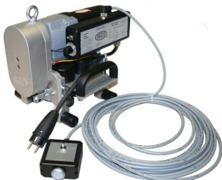
K9-1-ERB met optionele kabelafstandsbediening K9-1-KF

De optionele kabelafstandsbediening K9-1-KF is ideaal voor het gevaarloos en rationeel sluiten van ronde en staande naad profielen aan gevels en steile daken. De machine kan worden bediend vanuit een veilige positie en weer terug worden gereden. Dit verhoogt de veiligheid in de bouw enorm.